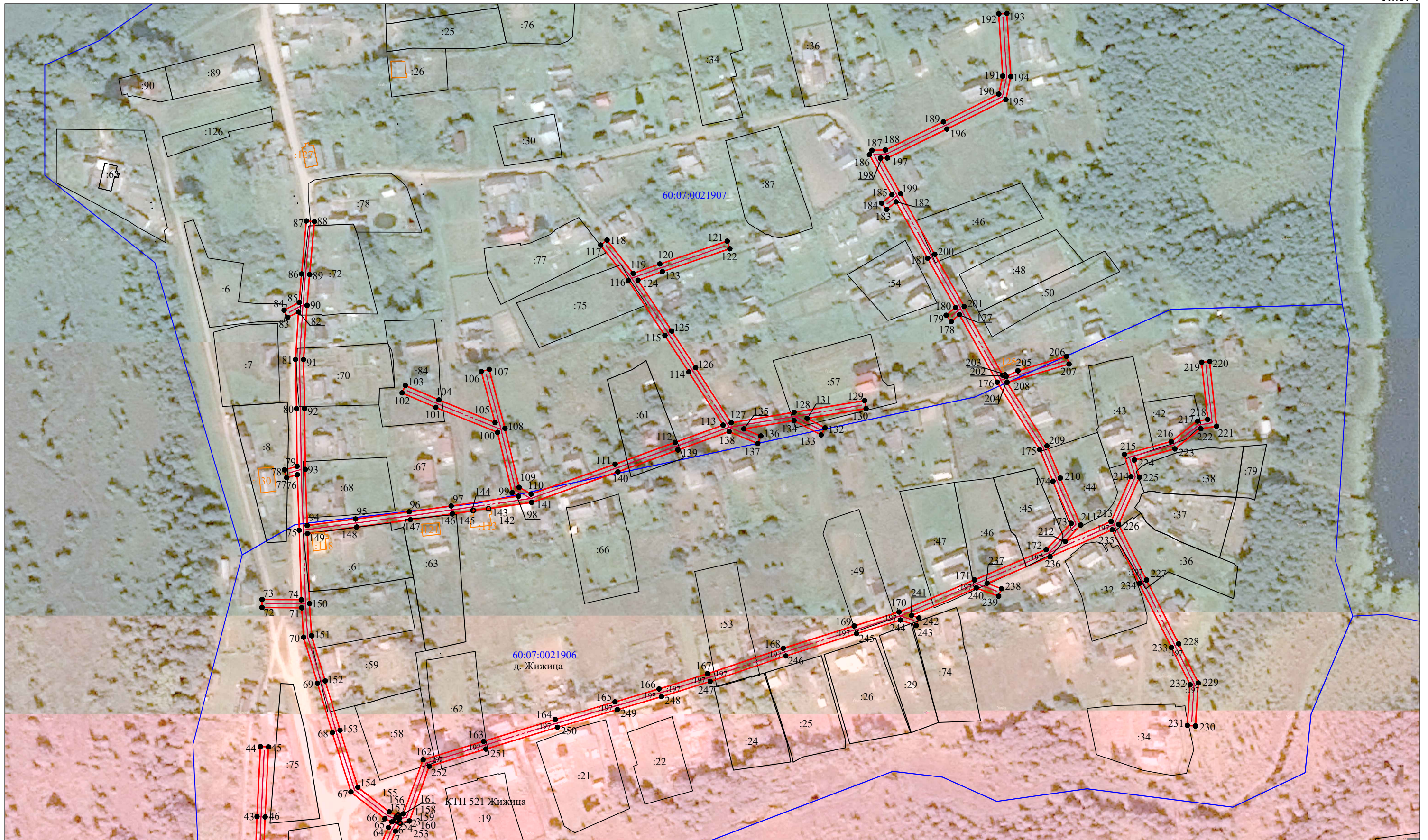
Схема расположения границ публичного сервитута "ВЛ 0.4 кВ от КТП 521 Жижца"