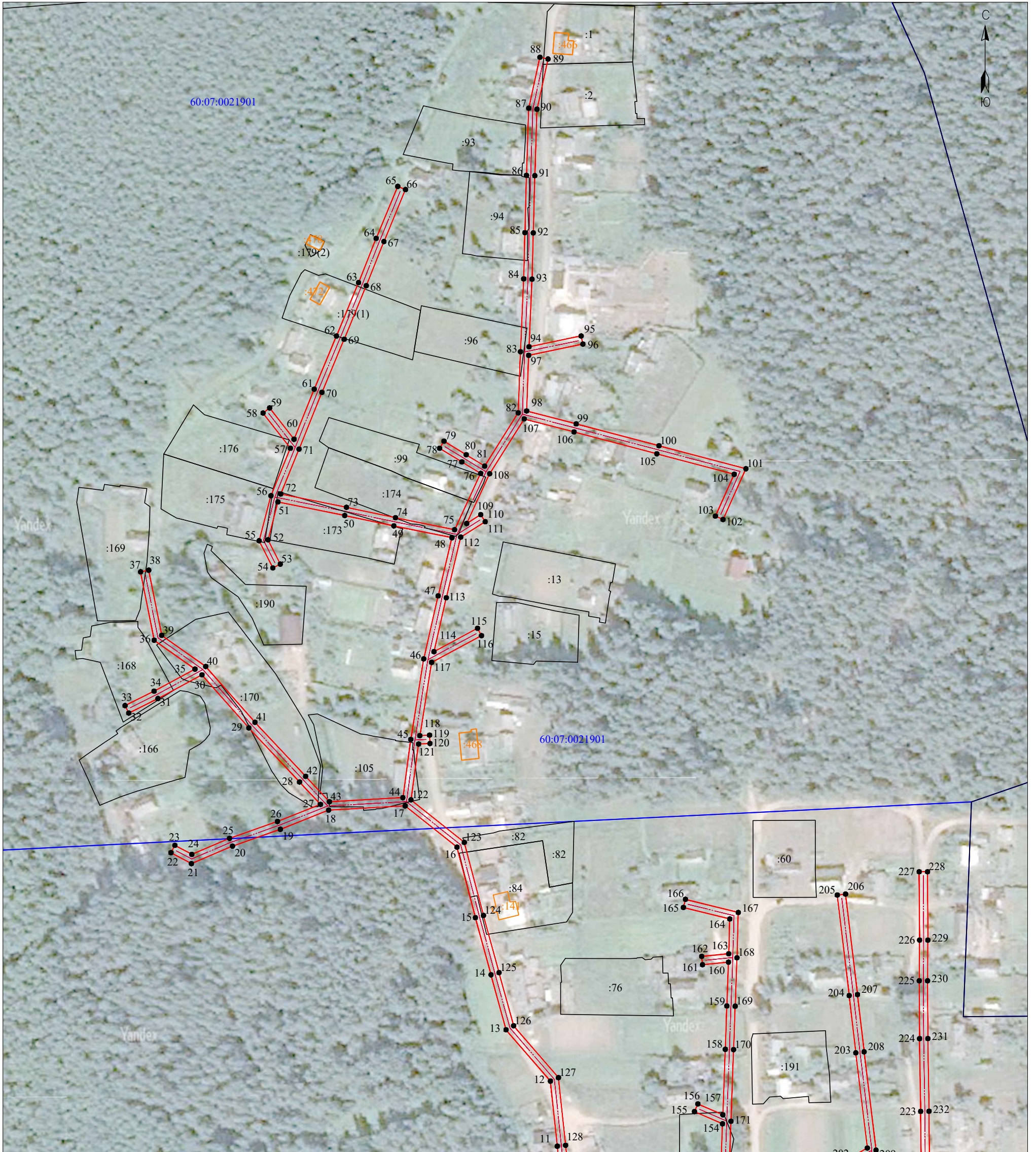
Масштаб 1:2 000

Используемые условные знаки и обозначения: